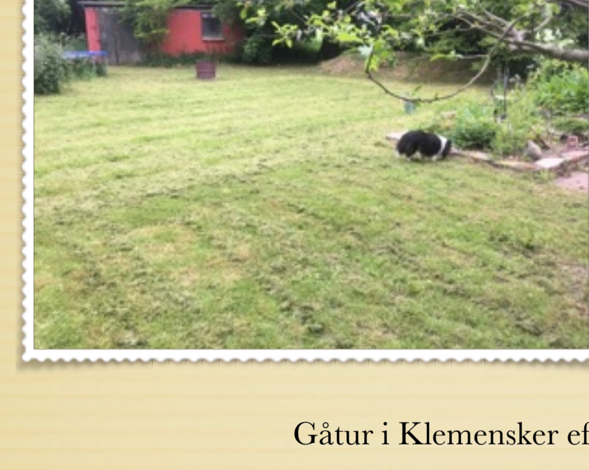
Gåtur i Klemensker efter søndags-brunch