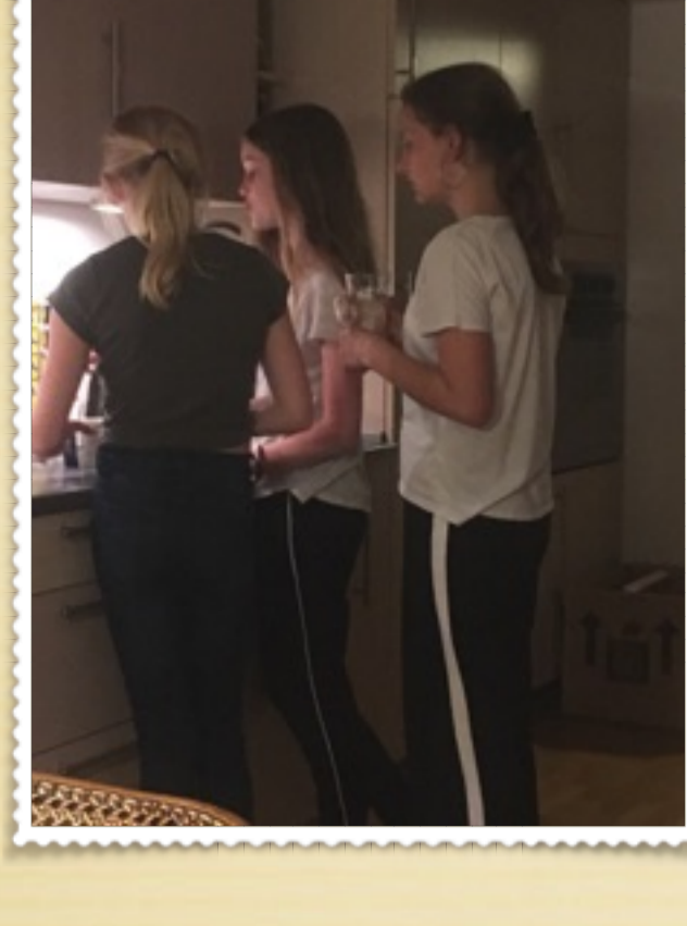
Te og hygge inden sovetid