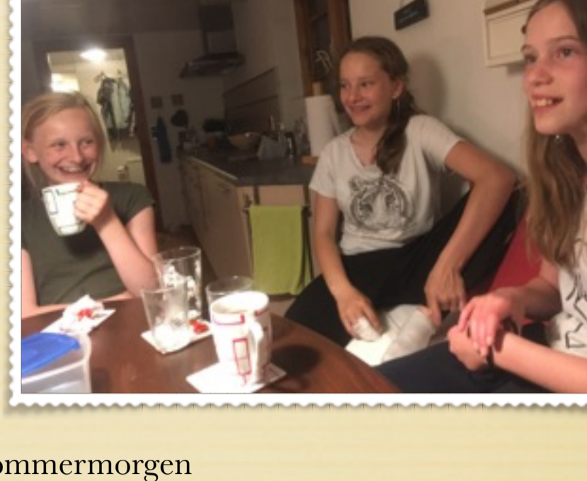
En skøn sommermorgen