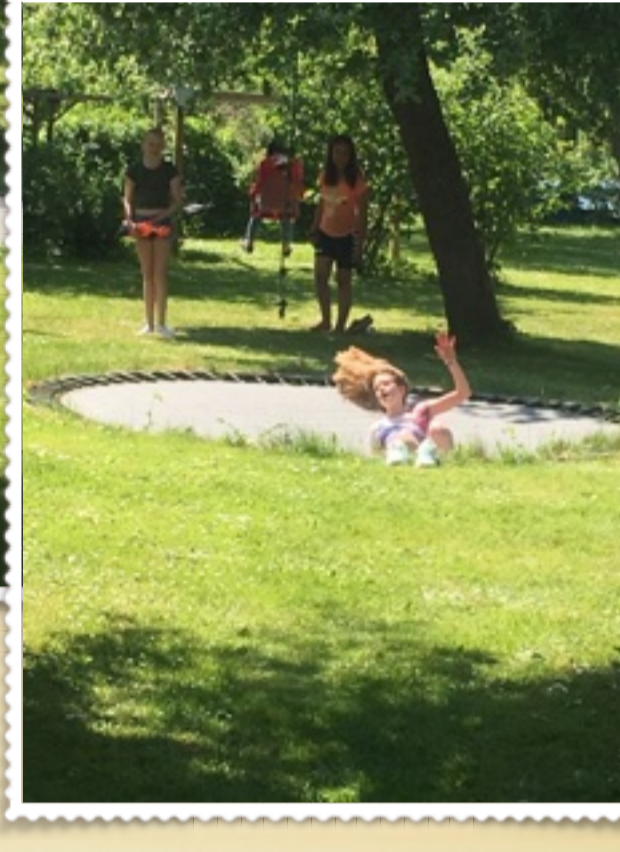
Imens resten bare nyder solens varme