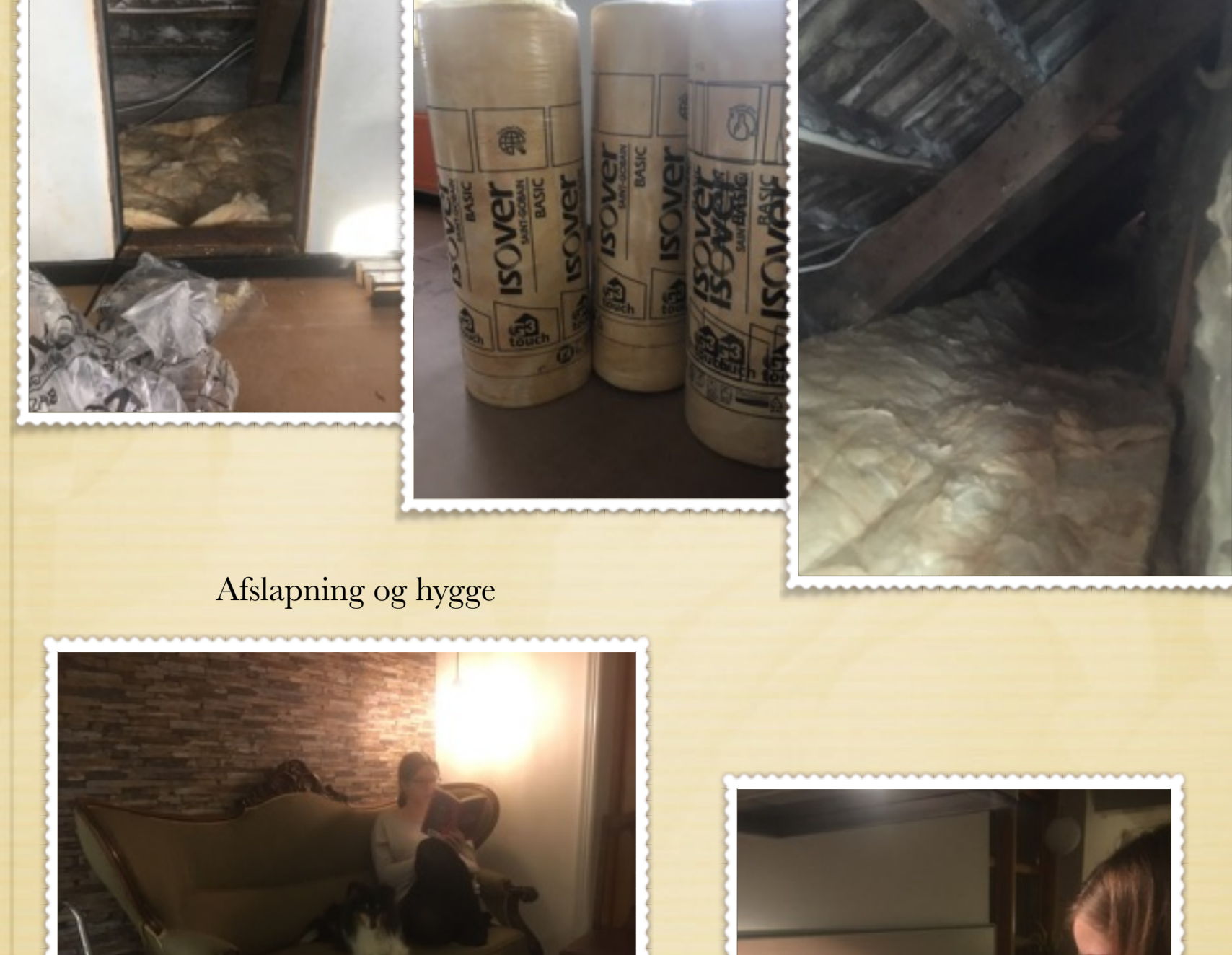
Afslapning og hygge

Med efterårets komme og vinteren der står for døren efterisoleres væggene på 1. salen, så stuen her forhåbentlig bliver lun i de kolde vinteraftener.