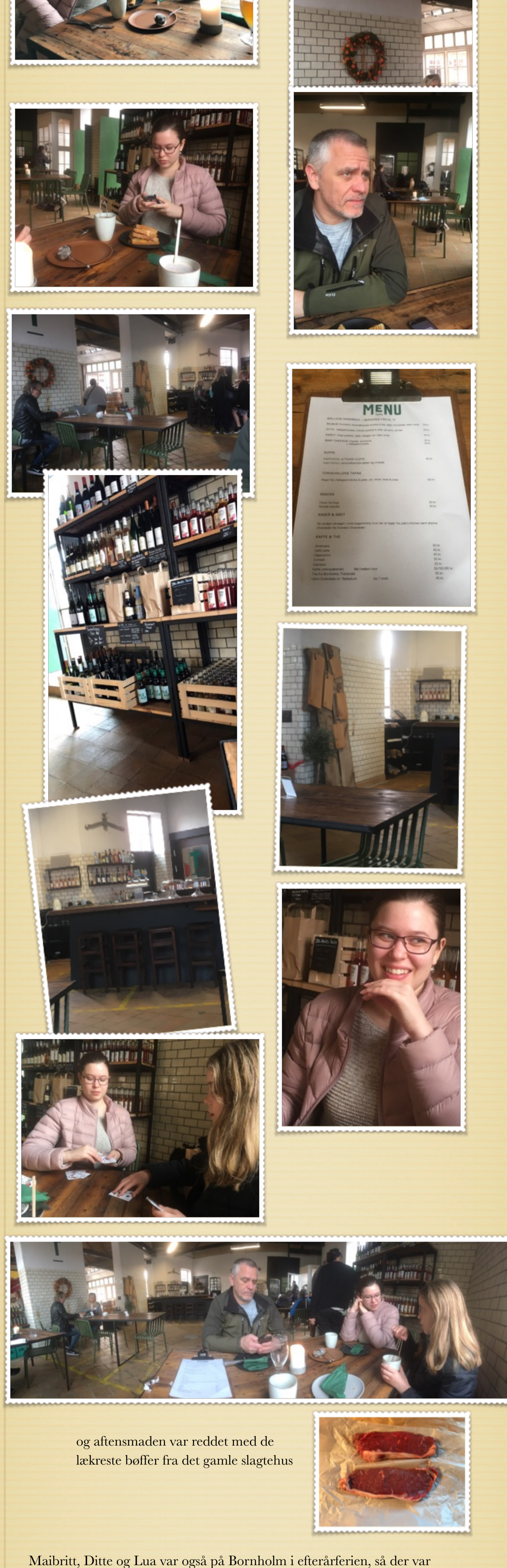
og aftenmaden var reddet med de lækreste bøffer fra det gamle slagtehus