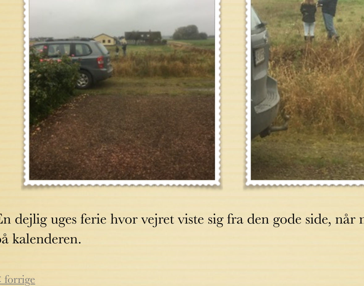
Silje og Anders forsøger at få helikopteren i luften, det kræver at det er vindstille