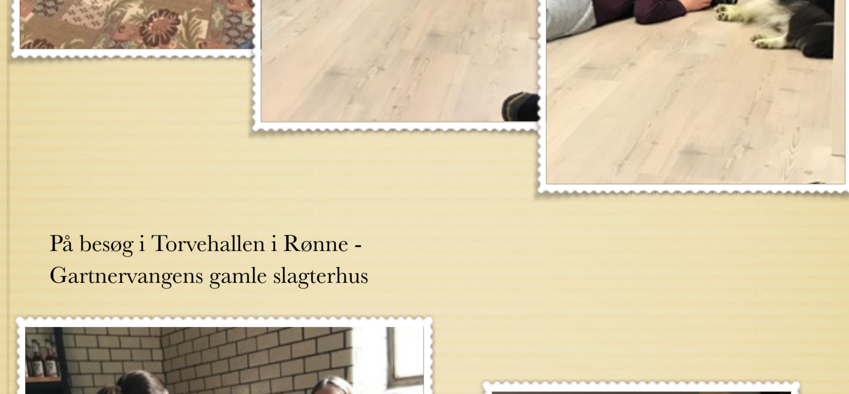
På besøg i Torvehallen i Romme - Gartnervangens gamle slagterhus